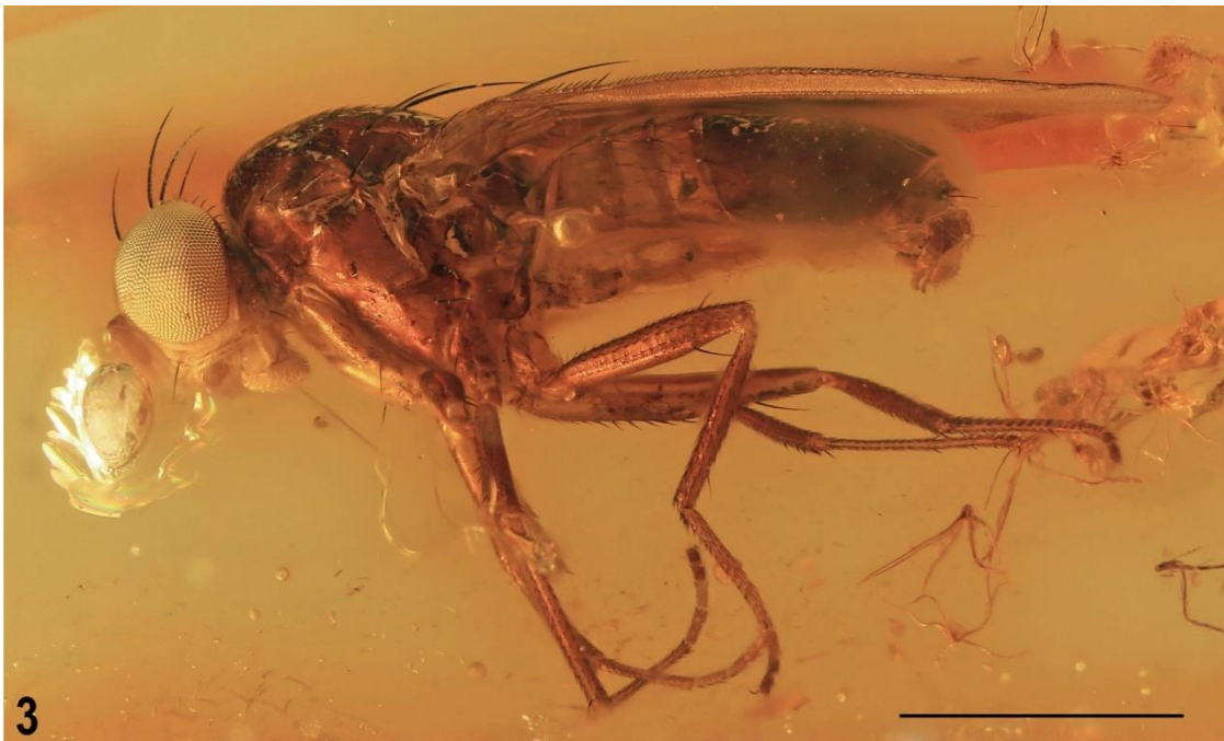
Fotografía macro de Christelenka multiplex . J. Roháček

Sevilla, 29 de junio de 2023. Un equipo científico internacional en el que participa la Estación Biológica de Doñana (EBD), del Consejo Superior de Investigaciones Científicas (CSIC) ha descrito por primera vez una especie representativa de una familia de insectos completamente nueva perteneciente al grupo Acalyptratae, el cual reúne a muchos de los polinizadores y carroñeros más importantes de los ecosistemas modernos. Lo ha hecho a partir de un fósil conservado en