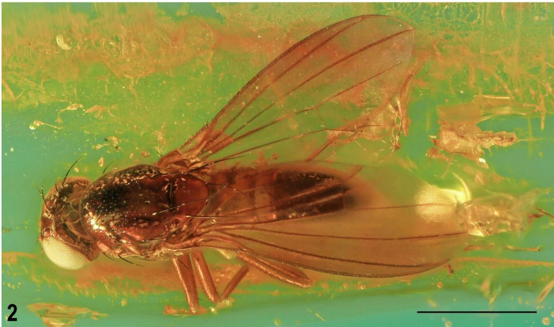
Fotografía de Christelinka multiplex. J. Roháček