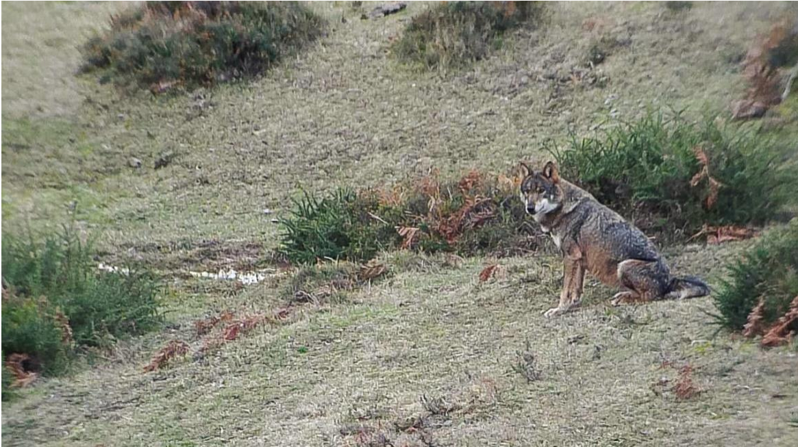
Lobo fotografiado en Asturias / Alberto Frenández-Gil

El equipo científico combinó la colección de localidades con y sin lobo extraídas del diccionario de Madoz con diferentes variables que describían características ambientales y de poblamiento humano para estimar mediante modelos estadísticos la distribución del lobo en España a mediados del siglo XIX. “Estos modelos permiten estimar la probabilidad de que el lobo estuviese presente en zonas en las que el Diccionario de Madoz no ofrece información” apunta Néstor Fernández.