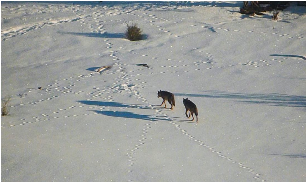
Dos lobos deambulan por la nieve en los montes de León

Comparando la situación actual con la distribución histórica, la superficie hoy ocupada supondría poco más del 30% de la histórica alcanzada a mediados del siglo XIX. Introduciendo esta visión a largo plazo, “la supuesta expansión reciente de la especie supondría poco más que una estabilización del acusado declive sufrido por la especie”, indica el investigador. Una auténtica recuperación de la especie y de sus importantes funciones ecológicas implicaría su