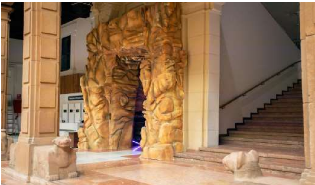
Nueva entrada exposición ‘GeoSevilla’

Pero esto no es todo, la reapertura del Museo también viene acompañada de novedades en sus instalaciones , entre ellas, se ha procedido a la renovación de la entrada de la exposición ‘GeoSevilla’, además de la entrada al Planetario, seguido de la creación del ‘espacio Marte’ y la adecuación museográfica de la sala de exposiciones de la primera planta, que en octubre acogerá una nueva muestra temporal.