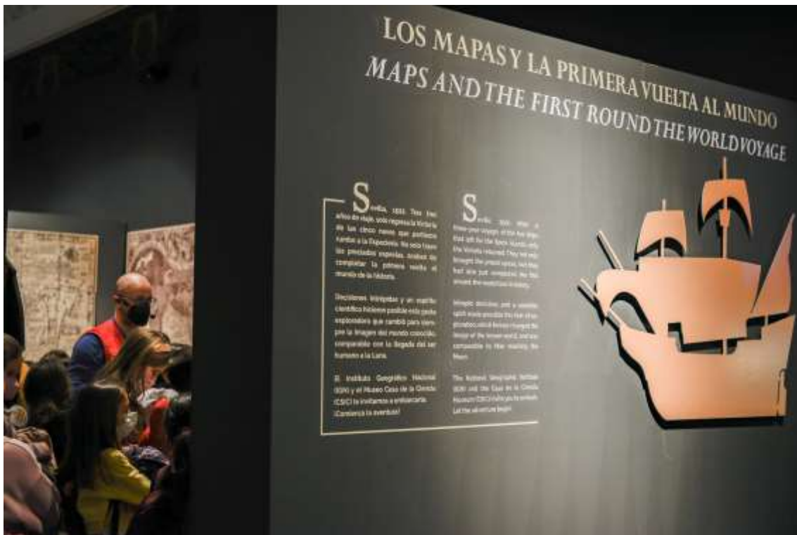
Visitantes del Museo en la exposición 'Los mapas y la primera vuelta al mundo'