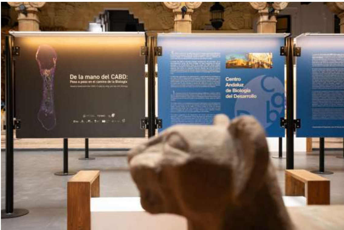
Exposición ‘De la mano del CABD: Paso a paso en el camino de la Biología’

Este nuevo ciclo comienza con el estreno de una nueva galería fotográfica, una exposición ideada por el Centro Andaluz de Biología del Desarrollo (CABD), un centro de investigación mixto del CSIC, la Universidad Pablo de Olavide y la Junta de Andalucía. Este recorrido fotográfico se titula “De la mano del CABD” y es fruto de líneas de investigación activas que se desarrollan en el Centro de Excelencia María de Maeztu, mediante el uso de imágenes reales tomadas gracias a un equipamiento de microscopía de última generación y una multitud de técnicas moleculares avanzadas que dan respuesta a preguntas fundamentales que plantea la Biología. El/la espectador/a disfrutará de la belleza que esconden los “secretos” de esta rama del conocimiento, que, en muchas ocasiones, reúnen ciencia y arte en una misma imagen.