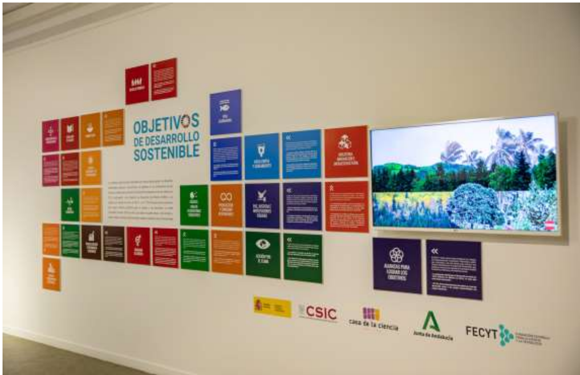
Módulo expositor Objetivos de Desarrollo Sostenible